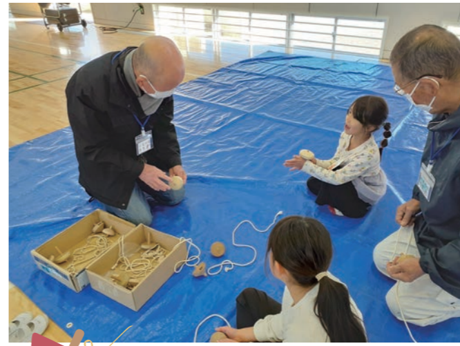
こまってどうやってまわすの？

社会福祉協議会では、地域福祉推進のために「いくつになっても長生村で安心して今の生活を続けていくためには地域で（今、私に）何ができるのか」をメインテーマとして各地区ごとに座談会を実施しています。今回は高根地区の活動を紹介します。高根地区のながいきMURA座談会は、「子どもたちの交流を通して地域全体を活性化