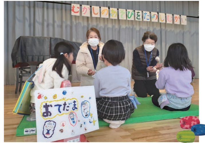
お手玉じょうずにできるかな？

していく」ことを目指して活動をしています。高根小学校の「親子ふれあいスポーツ体験」では、高根地区のながいきMURA座談会メンバーがポッチャの審判として協力したことがきっかけで、令和6年1月17日（水）に行われた、高根小学校1年生の授