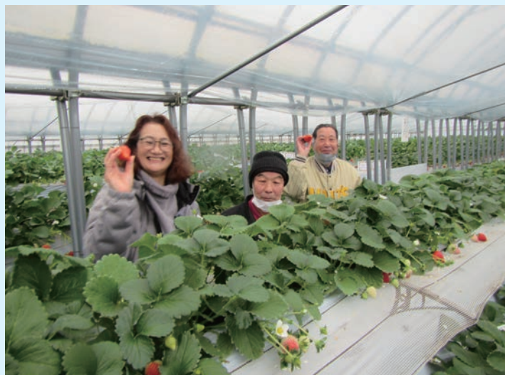
みんなで楽しくいちご狩り

あいにく雨の降る中で研修となりましたが、山武市成東のいちご園では高設栽培のいちごを車椅子に乗ったまま摘み取ることができ、大粒ないちごをみんなで楽しみました。約4年ぶりに他市町福祉会の会員にも会い、楽しい1日となりました。