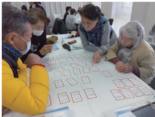
グループワーク中

視点を変えることにより、少しの手助けで認知症の人が、「今まで通りにできること」が多数あることを知りました。また、認知症の人やその家族を中心に、地域の人や支援者などが共に支え合える取組み作りが必要なことに気づかされました。認知症の人とともに暮らしやすい村づくりに繋がっていきます。