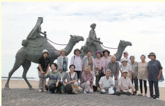
俳句教室吟行会・御宿海岸

記念館の見学の後には、天候に恵まれた目の前の海岸でブルーシートを広げ、穏やかな海・姫とラクダの像を見ながら一生懸命に句を考えました。帰りのバスで俳句の披露があり、それぞれの瞬間や思いが感じられ素晴らしい吟行会となりました。