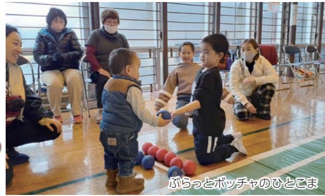
ぶらっとポッチャのひとこま

「気軽にポッチャを通して多世代交流ができる」ことを目指し、企画・運営をながいきMURA座談会が行っています。