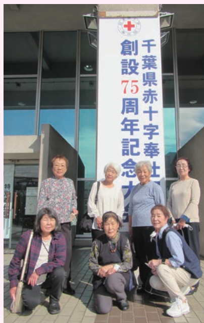
75周年記念大会にて

赤十字奉仕団は赤十字運動の推進役として全国各地に組織された救急救命、災害救助などをテーマにボランティア活動を行っている団体です。長生村赤十字奉仕団は防災・減災、救急法の講習や研修会を開催しています。興味関心のある方はぜひ一緒に活動しましょう。