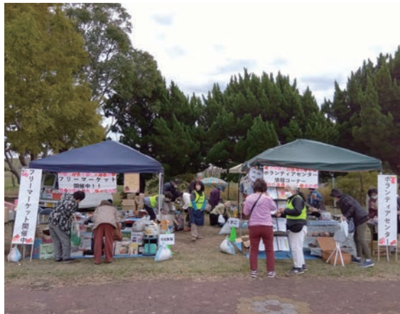
フリーマーケットの様子

また、当日の会場内衛生管理、荷物預かり所運営などにボランティアセンター登録者も協力してくれました。ご協力誠にありがとうございました。